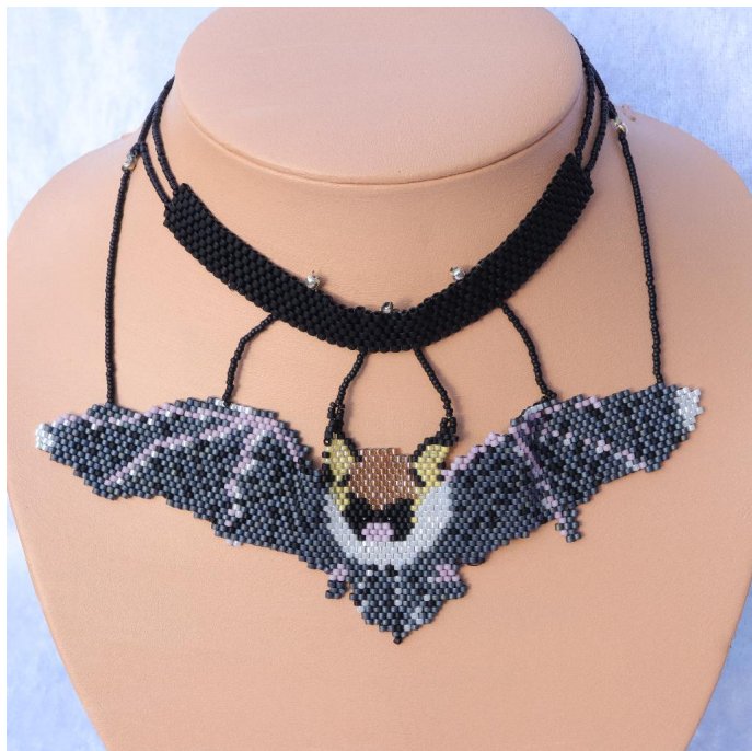
10132 - Ausgefallenes Halsband Gothic Schmetterling in Peyote 925er