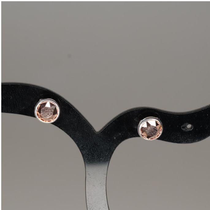
12192 - 925er Ohrstecker mit Swarovski® Chaton 8mm crystal rose